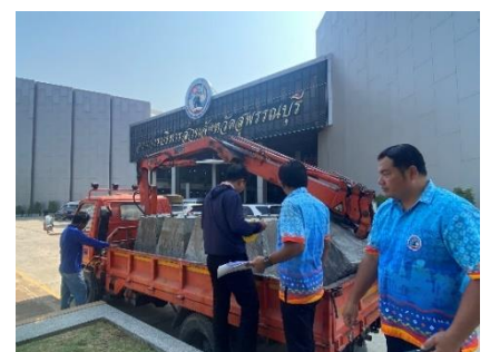
ดำเนินการนำคณะกรรมการตรวจรับอุปกรณ์เสาดัดตั้งกล้องโทรทัศน์วงจรปิด CCTV (๑๕ ล้าน)