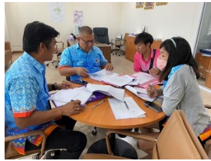
เข้าร่วมประชุมคณะกรรมการรับโอนสิทธิ์ของกลุ่มจังหวัดภาคกลางตอนล่าง ๑ (๑.ชุดประธานน้ำพร้อมอุปกรณ์ ๒.ติดตั้งระบบมัลติเทคโนโลยีเทคโนโลยี ภายในบริเวณบึงฉวากเฉลิมพระเกียรติฯ)