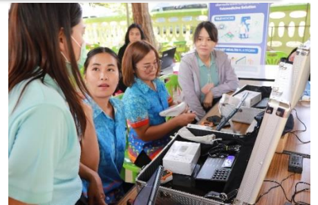
ดำเนินการลงพื้นที่เข้าศึกษาดูงาน โครงการ smart รพ.สต.ที่ รพ.สต.บ้านสามัคคีธรรม