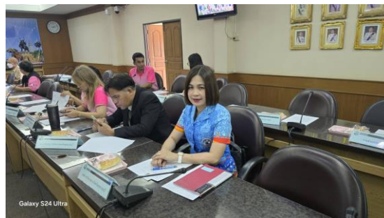
เข้าร่วมประชุมคณะกรรมการบริหารงานจังหวัดแบบบูรณาการจังหวัดสุพรรณบุรี (อ.ก.บ.จ.สพ) ด้านการพัฒนาสังคมและคุณภาพชีวิต ครั้งที่ ๑/๒๕๖๗