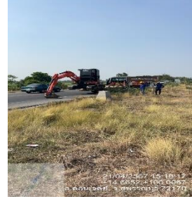
ดำเนินการลงพื้นที่ควบคุมงานโครงการเพิ่มศักยภาพในการป้องกันชีวิตและทรัพย์สินของประชาชน โดยการจัดซื้อกล้องโทรทัศน์วงจรปิด (CCTV) จำนวน ๑๓๐ ตัว ๑๕ ล้านบาท ณ อำเภอสามชุก และอำเภอบางปลาม้า