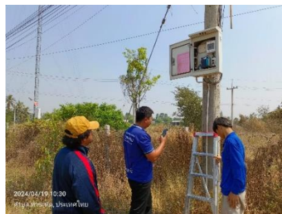
ดำเนินการลงพื้นที่ออกตรวจโครงการจ้างเหมาบำรุงรักษากล้องโทรทัศน์วงจรปิด (CCTV) (MA) เดือนเมษายน อำเภอเมืองสุพรรณบุรี และอำเภออู่ทอง