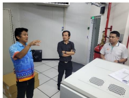
เจ้าหน้าที่จากกองสาธารณสุข พาคณะจากบริษัท เจ็ท เมดติคอล (ไทยแลนด์) จำกัด ดูงานห้อง Data Center ณ ห้องปฏิบัติงานฝ่ายสถิติข้อมูลและสารสนเทศ