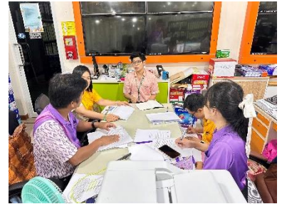
ประชุมคณะกรรมการกำหนดคุณลักษณะเฉพาะ และกำหนดราคากลาง โครงการกล้องโทรทัศน์วงจรปิด (CCTV) ๑.๗ ล้านบาท ครั้งที่ ๗/๒๕๖๗