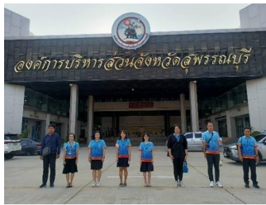
เข้าร่วมกิจกรรมเข้าแถวเคารพธงชาติหน้าเสาธง องค์การบริหารส่วนจังหวัดสุพรรณบุรี