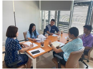
ประชุมติดตามงานหัวหน้าฝ่าย ของกองยุทธศาสตร์และงบประมาณ