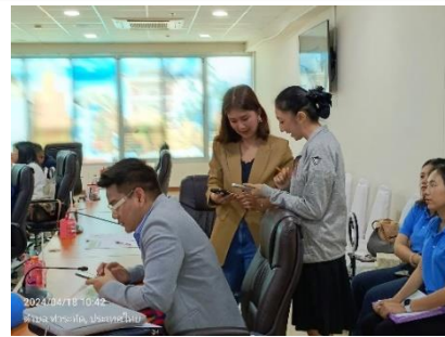
นำคณะเจ้าหน้าที่จากบริษัทเข้านำเสนอระบบซอฟต์แวร์ รพ.สต. ณ ห้องประชุม ๑ ข้างตึกนายนก ชั้น ๓ อบจ.สุพรรณบุรี