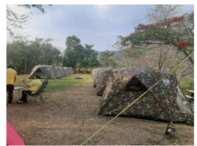
เข้าร่วมโครงการส่งเสริมการท่องเที่ยวจังหวัดสุพรรณบุรี วันที่ ๑๘ ถึง ๑๙ เมษายน ๒๕๖๗ ณ อุทยานแห่งชาติพุเตย ต.วังยาว อ.ด่านช้าง จ.สุพรรณบุรี