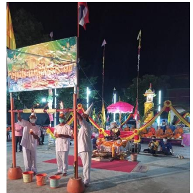
หมู่ที่ ๑ บ้านสามทอง ตำบลตลิ่งชัน อำเภอเมืองสุพรรณบุรี จังหวัดสุพรรณบุรี ๗๒๒๓๐