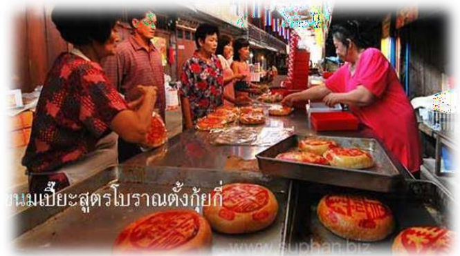
ขนมเปี๊ยะสูตรโบราณตั้งกุ๊กกี๊