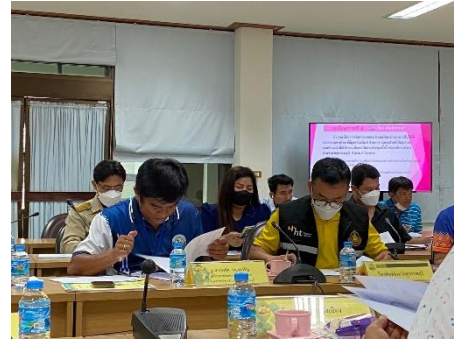
เข้าร่วมประชุมคณะกรรมการบริหารและจัดหาระบบคอมพิวเตอร์ของหน่วยงานในสังกัดกระทรวงมหาดไทยจังหวัดสุพรรณบุรี ครั้งที่ ๒/๒๕๖๖