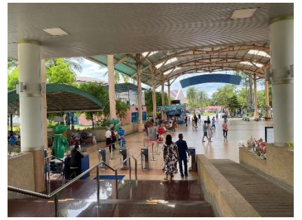
ดำเนินการลงพื้นที่ปฏิบัติหน้าที่ตรวจติดตามสถานแสดงพันธุ์สัตว์น้ำบึงฉวากเฉลิมพระเกียรติ