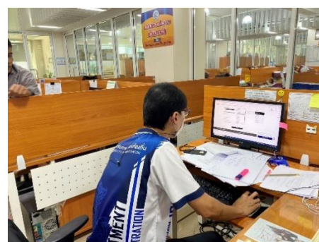
ดำเนินการซ่อมบำรุงดูแลรักษาเครื่องคอมพิวเตอร์/เครื่องปริ้นเตอร์/ลงโปรแกรม, เซิร์ฟเวอร์โทรศัพท์ กองพัสดุและทรัพย์สิน,หน่วยตรวจสอบภายใน, ห้องประชาสัมพันธ์, กองสาธารณสุข, สำนักปลัดฯ, สำนักเลขาฯ, ห้องประชุมสภาฯ, ห้องประชุมข้างห้องนายกฯ, กองพัสดุฯ, กองการศึกษาฯ และห้องกองการเจ้าหน้าที่