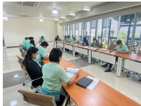
เข้าร่วมประชุม รายงานการติดตามการใช้จ่ายเงินงบประมาณขององค์การบริหารส่วนจังหวัดสุพรรณบุรี ประจำปีงบประมาณ ๒๕๖๔ ถึง ปีงบประมาณ ๒๕๖๕