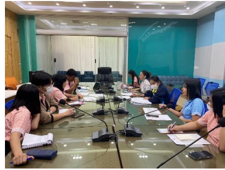
เข้าร่วมประชุมพิจารณาผลโครงการครุภัณฑ์ระบบดับเพลิงอัตโนมัติและอุปกรณ์ รักษาความปลอดภัยเพื่อติดตั้งภายในห้องเครื่องคอมพิวเตอร์แม่ข่าย (Data Center)