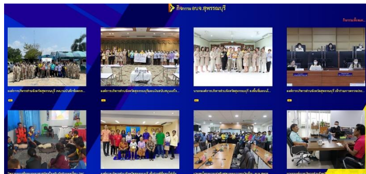
ดำเนินการลงข้อมูลกิจกรรมองค์การบริหารส่วนจังหวัดสุพรรณบุรี ลงบนเว็บไซต์ www.suphan.go.th