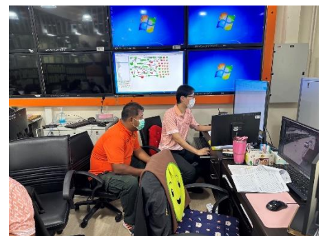
ดำเนินการให้บริการเจ้าหน้าที่ตำรวจ และประชาชน ในการดูภาพย้อนหลังจากกล้องโทรทัศน์วงจรปิด (CCTV) ณ ห้องฝ่ายสถิติข้อมูลและสารสนเทศ อบจ.สุพรรณบุรี