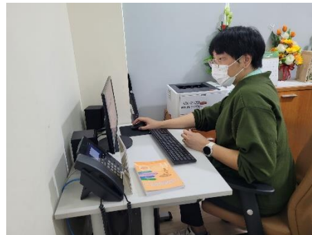
ดำเนินการซ่อมบำรุงดูแลรักษาเครื่องคอมพิวเตอร์/เครื่องปริ้นเตอร์/ลงโปรแกรม, เชื่อมระบบโทรศัพท์ กองทัสตุและทรัพย์สิน, หน่วยตรวจสอบภายใน, ห้องประชาสัมพันธ์, กองสาธารณสุข, สำนักปลัดฯ, สำนักเลขาฯ, ห้องประชุมสภาฯ, ห้องประชุมข้างห้องนายกฯ, กองทัสตุฯ, กองการศึกษา และห้องกองการเจ้าหน้าที่