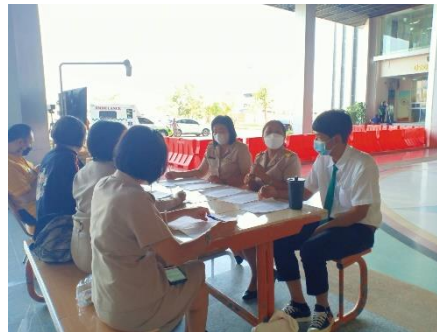
ปฏิบัติหน้าที่จัดอนุมัติบุคลากรขององค์การบริหารส่วนจังหวัดสุพรรณบุรี