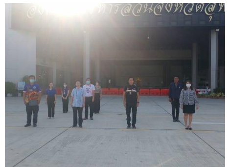
เข้าร่วมกิจกรรมเข้าแถวเคารพธงชาติหน้าเสาธง องค์การบริหารส่วนจังหวัดสุพรรณบุรี