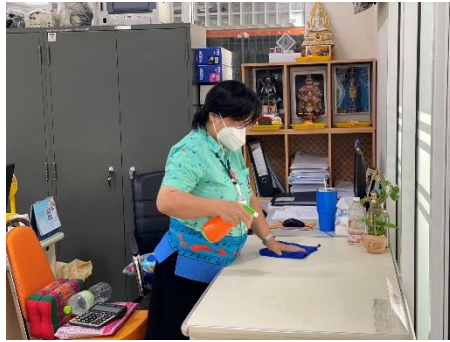
ดำเนินการกิจกรรม ๕ ส โดยการทำทำความสะอาด และฉีดพ่นฆ่าเชื้อโรคติดต่อโควิด - ๑๙ อุปกรณ์ทำงานพื้นที่ทำงานกองยุทธศาสตร์ และงบประมาณ