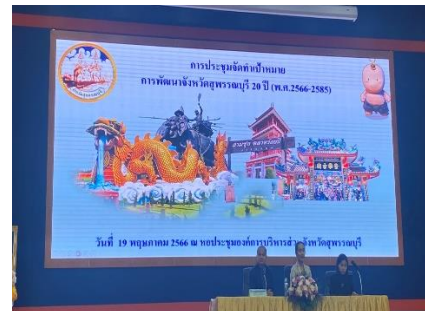
เข้าร่วมการประชุมการจัดทำเป้าหมายการพัฒนาจังหวัดสุพรรณบุรี ๒๐ ปี (พ.ศ.๒๕๖๖ - ๒๕๘๕)