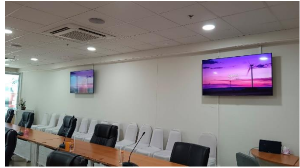
ควบคุมห้องประชุมและจอภาพ LED การประชุมกีฬาฟุตบอล ปีที่ ๒ ประจำปี ๒๕๖๖ ณ ห้องประชุม ๑ ชั้นห้องนายก