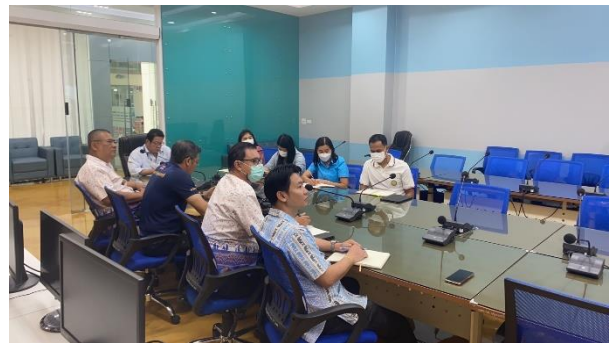
ดำเนินการควบคุมคอมพิวเตอร์และจอภาพ LED การประชุมเกี่ยวกับเทลามิสต์ ผ่านระบบ Zoom ณ ห้องปฏิบัติการ Conference Room