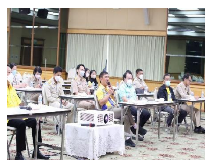
เข้าร่วมมอบครุภัณฑ์การแพทย์ โครงการพัฒนาห้องผ่าตัด แผนกศัลยกรรม ออร์โธปิดิกส์ รพ.เจ้าพระยายมราช