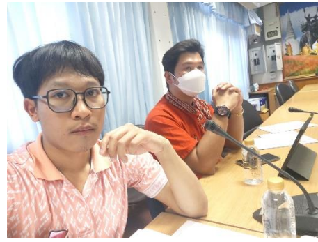
เข้าร่วมประชุมคณะกรรมการกลั่นกรอง โครงการจัดระบบครุภัณฑ์คอมพิวเตอร์ ของหน่วยงานในสังกัดกระทรวงมหาดไทย จังหวัดสุพรรณบุรี ครั้งที่ ๑/๒๕๖๖