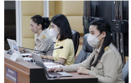
เข้าร่วมประชุมตรวจประเมินเชิงลึกรอบที่ ๒ รางวัลองค์กรปกครองส่วนท้องถิ่นที่มีการบริหารจัดการที่ดี