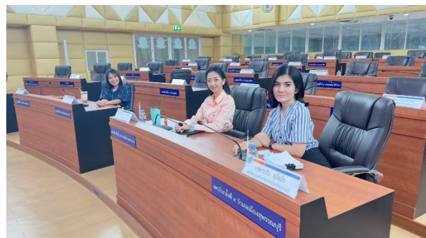
ดำเนินการเตรียมความพร้อมการประชุมโครงการรางวัลพระปกเกล้า ชักซ้อมการรายงานผลและเตรียมไฟล์พร้อมสถานที่ ณ ห้องประชุมสภา ชั้น ๓ อบจ.สุพรรณบุรี