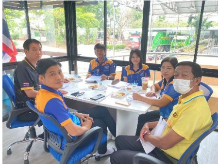
ดำเนินการเข้าร่วมประชุม TOR ที่องค์การบริหารส่วนตำบลทับตีเหล็ก