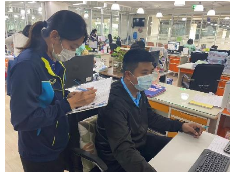
ดำเนินการออกตรวจโปรแกรมอัปเดตประจำปี คอมพิวเตอร์สำนักงาน องค์การบริหารส่วนจังหวัดสุพรรณบุรี