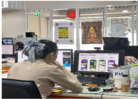
ดำเนินการเข้าร่วมรับฟัง เรื่อง How to ใช้ Facebook สื่อสารกับประชาชนอย่างไรให้มีประสิทธิภาพงานนี้เพื่อเจ้าหน้าที่รัฐ มา Upskill ฟรี! กับ TDGA by DGA (ระบบออนไลน์)