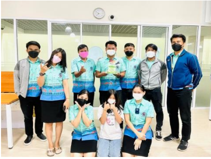
๑) กิจกรรม ๓ ม.