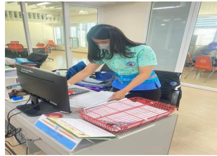
๓) ทำความสะอาด และฉีดพ่นน้ำยาฆ่าเชื้อ เพื่อป้องกันไวรัส COVID - ๑๙ บริเวณห้องทำงาน