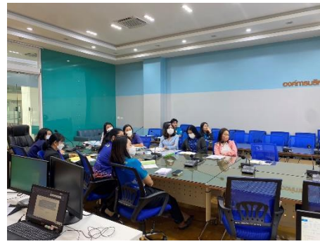
ดำเนินการควบคุมคอมพิวเตอร์และจอภาพ LED การประชุมชี้แจงเรื่องการจัดซื้อจัดจ้างให้กับ รพ.สต.