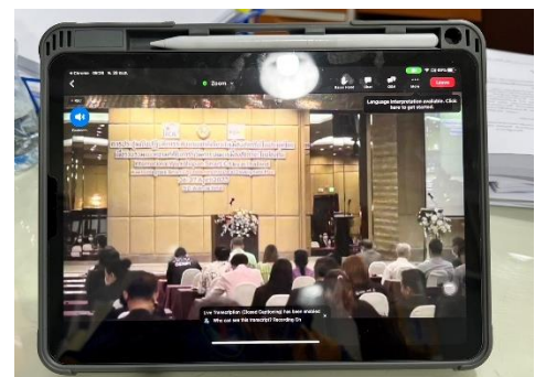
เข้าร่วมประชุมโครงการประชุมเชิงปฏิบัติการระดับนานาชาติเกี่ยวกับเมืองอัจฉริยะในประเทศไทย เพื่อรวบรวมแนวความคิด ในการริเริ่มพัฒนาเมืองอัจฉริยะในท้องถิ่น ณ โรงแรม เอสดี อเวนิว และ ผ่านระบบ Online