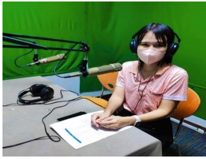
เข้าร่วมบันทึกเสียงรายการวิทยุ "อบจ.สุพรรณบุรี พบประชาชน"