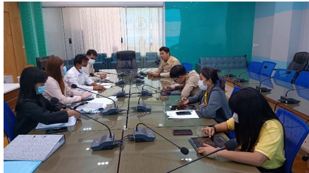
เข้าร่วมประชุมชี้แจงโครงการจ้างเหมาบำรุงรักษาระบบกล้องโทรทัศน์วงจรปิด