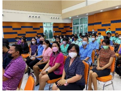
เข้าร่วมประชุมข้าราชการ ลูกจ้าง และพนักงานจ้างขององค์การบริหารส่วนจังหวัดสุพรรณบุรี ประจำเดือนเมษายน