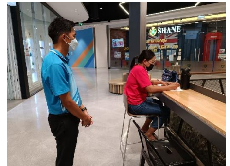
ดำเนินการลงพื้นที่ทอดแบบสอบถามประเมินโครงการส่งเสริมศักยภาพช่วงปิดภาคเรียน Smart Summer camp