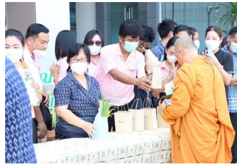
เข้าร่วมทำบุญตักบาตรอาหารแห้งประจำเดือนเมษายน ๒๕๖๖ ของบุคลากรองค์การบริหารส่วนจังหวัดสุพรรณบุรี