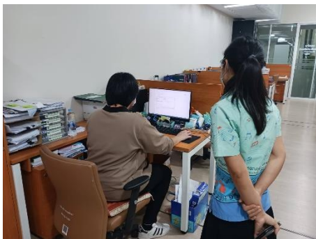
ดำเนินการซ่อมบำรุงดูแลรักษาเครื่องคอมพิวเตอร์/เครื่องปริ้นเตอร์/ลงโปรแกรม, เซ็ตระบบโทรศัพท์ กองทัสดูแลทรัพย์สิน,หน่วยตรวจสอบภายใน, ห้องประชาสัมพันธ์,กองสาธารณสุข, สำนักปลัดฯ , สำนักเลขาฯ , ห้องประชุมสภา , ห้องประชุมช่างห้องนายกฯ , กองทัสดูแล , กองการศึกษา และห้องกองการเจ้าหน้าที่