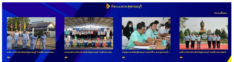
ดำเนินการลงข้อมูลกิจกรรมองค์การบริหารส่วนจังหวัดสุพรรณบุรี ลงบนเว็บไซต์ www.suphan.go.th