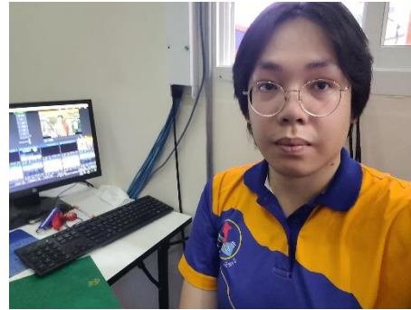
ดำเนินการจัดเตรียมและควบคุมจอสำหรับงานอบรมให้ความรู้ฯ การไฟฟ้าส่วนภูมิภาค จังหวัดสุพรรณบุรี ณ หอประชุมใหญ่