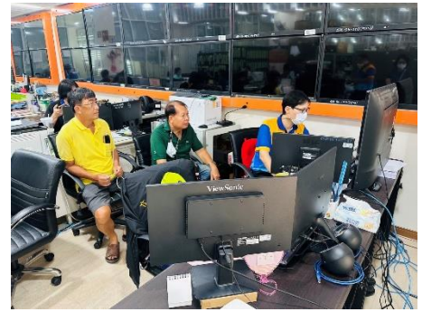
ดำเนินการให้บริการเจ้าหน้าที่ตำรวจ และประชาชน ในการดูภาพย้อนหลังจากกล้องโทรทัศน์วงจรปิด (CCTV) ณ ห้องฝ่ายสถิติข้อมูลและสารสนเทศ อบจ.สุพรรณบุรี