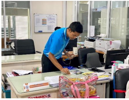
ดำเนินการกิจกรรม ๕ ส โดยการทำความสะอาด และฉีดพ่นฆ่าเชื้อโรคติดต่อโควิด - ๑๙ อุปกรณ์ทำงานพื้นที่ทำงานกองยุทธศาสตร์ และงบบประมาณ