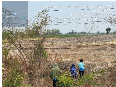
ดำเนินการออกเช็คจุดติดตั้งกล้อง ณ อำเภอหนองหญ้าไซ