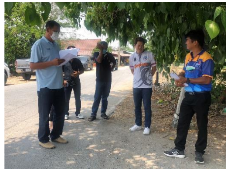
ดำเนินการออกตรวจเช็คจุดติดตั้งกล้องโทรทัศน์วงจรปิด CCTV ณ บ้านโพธิ์สุพรรณ