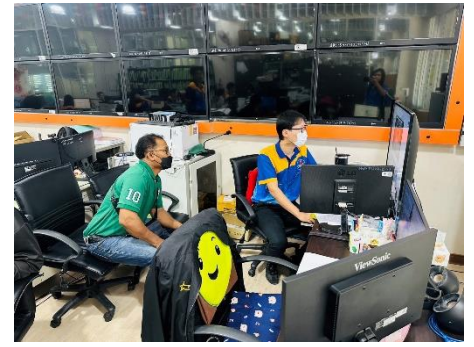
ดำเนินการให้บริการเจ้าหน้าที่ตำรวจ และประชาชน ในการดูภาพย้อนหลังจากกล้องโทรทัศน์วงจรปิด (CCTV) ณ ห้องฝ่ายสถิติข้อมูลและสารสนเทศ อบจ.สุพรรณบุรี