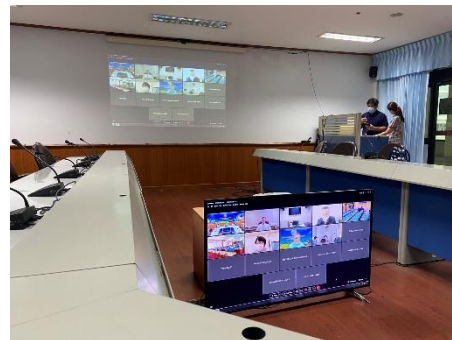
เข้าร่วมการประชุมคณะกรรมการกำหนดแผนบริหารจัดการ ระบบการเชื่อมโยงกล้องโทรทัศน์วงจรปิด (CCTV) และการใช้ประโยชน์จากข้อมูลครั้งที่ ๑/๒๕๖๖