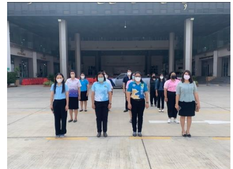
เข้าร่วมกิจกรรมเข้าแถวเคารพธงชาติหน้าเสาธง องค์การบริหารส่วนจังหวัดสุพรรณบุรี