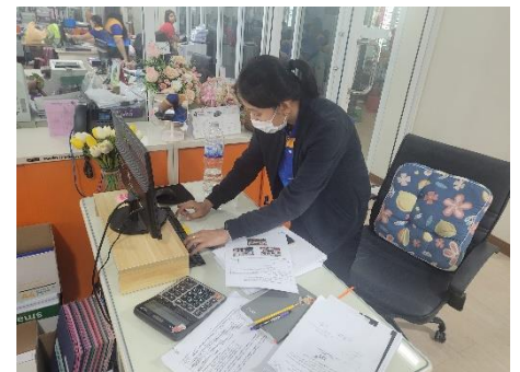
ดำเนินการซ่อมบำรุงดูแลรักษาเครื่องคอมพิวเตอร์/เครื่องปริ้นเตอร์/ลงโปรแกรม, เชื่อมระบบโทรศัพท์ กองพัสดุและทรัพย์สิน,หน่วยตรวจสอบภายใน, ห้องประชาสัมพันธ์,กองสาธารณสุข, สำนักปลัดฯ, สำนักเลขาฯ, ห้องประชุมสภาฯ, ห้องประชุมข้างห้องนายกฯ, กองพัสดุฯ, กองการศึกษาฯ และห้องกองการเจ้าหน้าที่