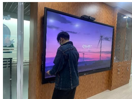
ดำเนินการควบคุมคอมพิวเตอร์และจอภาพ LED การประชุมปรึกษาหารือเกี่ยวกับเรื่อง สุขภาพจิต ณ ห้องประชุม ๑ ข้างห้องนายก ชั้น ๓ อบจ.สุพรรณบุรี