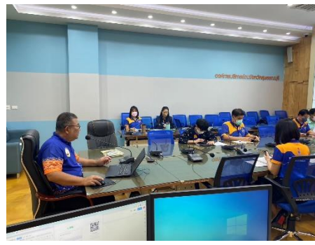
เข้าร่วมประชุมการเข้าร่วมโครงการประเมินประจำปี พ.ศ.๒๕๖๖ ณ ห้องปฏิบัติการ Conference Room