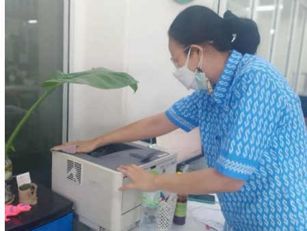
ดำเนินการกิจกรรม ๕ ส โดยการทำมาความสะอาด และฉีดพ่นฆ่าเชื้อโรคติดต่อโควิด - ๑๙ อุปกรณ์ทำงานพื้นที่ทำงาน กองยุทธศาสตร์และงบประมาณ