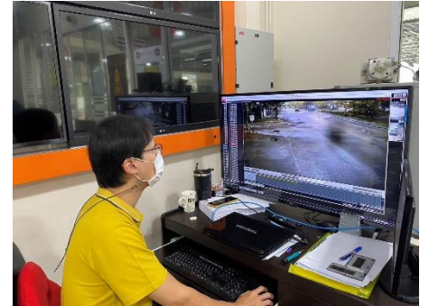
ดำเนินการให้บริการเจ้าหน้าที่ตำรวจ และประชาชน ในการดูภาพย้อนหลังจากกล้องโทรทัศน์วงจรปิด (CCTV) ณ ห้องฝ่ายสถิติข้อมูลและสารสนเทศ องค์การบริหารส่วนจังหวัดสุพรรณบุรี