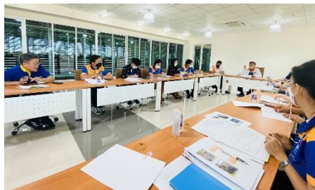
เข้าร่วมประชุมหัวหน้าส่วนขององค์การบริหารส่วนจังหวัดสุพรรณบุรี