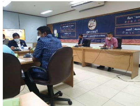
ดำเนินการเข้าร่วมประชุม การติดตามความคืบหน้าการบริการประชาชนด้วยระบบอิเล็กทรอนิกส์ (e-service) ในประเด็นการพัฒนาศูนย์บริการแบบเบ็ดเสร็จ (One Stop Service:OSS) ของศูนย์ดำรงธรรมจังหวัด ณ ห้องประชุมหลายแก้ว ชั้น ๔ ศาลากลางจังหวัดสุพรรณบุรี