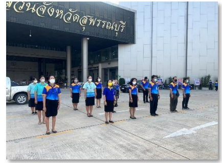
เข้าร่วมกิจกรรมเคารพธงชาติของบุคลากรองค์การบริหารส่วนจังหวัดสุพรรณบุรี