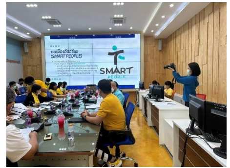
ดำเนินการเข้าร่วมประชุม แต่งตั้งคณะกรรมการขับเคลื่อนและบริหารโครงการเมืองอัจฉริยะ (Smart City) ประจำปีงบประมาณ ๒๕๖๖ ณ ห้องปฏิบัติการ Conference Room