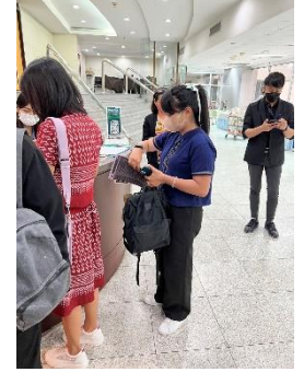
ดำเนินการเข้าร่วมโครงการฝึกอบรม งานสัมมนา Top ๑๐ Technology & Cyber Security Trends and Updates ๒๐๒๓ ณ ห้องออกต่อเตรียม ชั้น ๓ อาคารซอฟต์แวร์พาร์ค ถนนแจ้งวัฒนะ