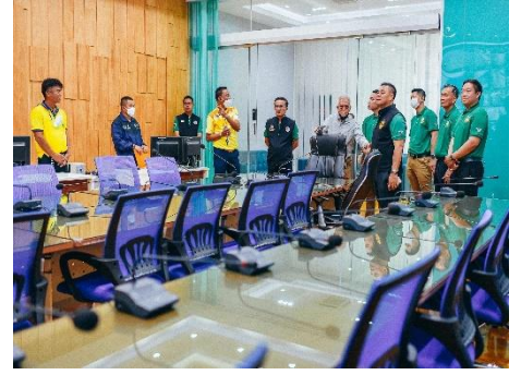
ดำเนินการควบคุมคอมพิวเตอร์และจอภาพ LED ต้อนรับคณะดูงานท่าน ดร.อุดม โปร่งฟ้า ดูงานกล้องโทรทัศน์วงจรปิด ณ ห้องปฏิบัติงาน Conferencr Room