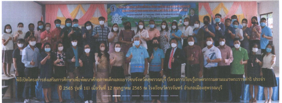
พิธีเปิดโครงการส่งเสริมการศึกษาเพื่อพัฒนาศักยภาพเด็กและเยาวชนจังหวัดสุพรรณบุรี (โครงการเรียนรู้เกษตรกรรมตามแนวพระราชดำริ ประจำปี 2565 รุ่นที่ 10) เมื่อวันที่ 12 กรกฎาคม 2565 ณ โรงเรียนวัดจรัลจันทร์ อำเภอเมืองสุพรรณบุรี