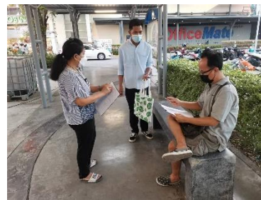
ดำเนินการลงพื้นที่ประเมินโครงการสืบสานเพลงลูกทุ่งและเพลงลูกกรุงจังหวัดสุพรรณบุรี ครั้งที่ ๒ ประจำปี ๒๕๖๕ ณ ศูนย์การค้าโรบินสัน ไลฟ์สไตล์ สุพรรณบุรี