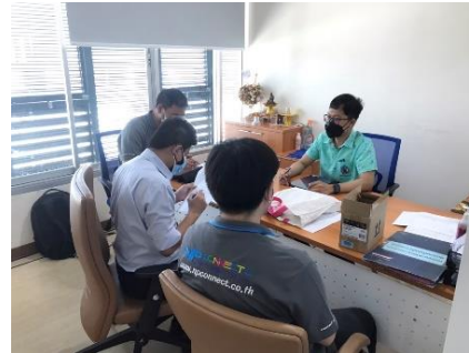
ปรึกษาหารือเบื้องต้นกับเจ้าหน้าที่ เรื่องการลงโปรแกรมวินโดว์กับออฟฟิต