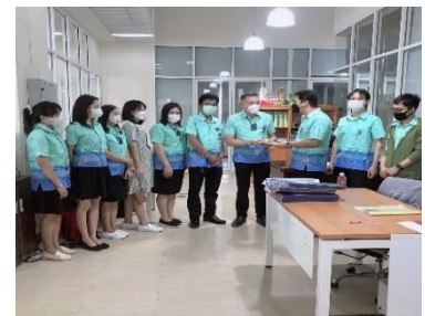
ร่วมแสดงความยินดีกับบุคลากรอบจ.สุพรรณบุรีเข้ารับตำแหน่งนักบริหารงานทั่วไประดับกลาง