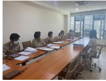
เข้าร่วมสัมมนาการคัดเลือกข้าราชการองค์การบริหารส่วนจังหวัดสุพรรณบุรีเพื่อเลื่อนและแต่งตั้ง ดำรงตำแหน่งในระดับที่สูงขึ้น ณ ห้องประชุมห้องรองปลัดองค์การบริหารส่วนจังหวัดสุพรรณบุรี