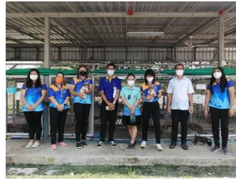
ดำเนินการลงพื้นที่เข้าตรวจติดตามและประเมินผลการใช้จ่ายเงินอุดหนุน โครงการบริหารจัดการศูนย์พักพิงสุนัขจังหวัดสุพรรณบุรี (แห่งที่ ๒