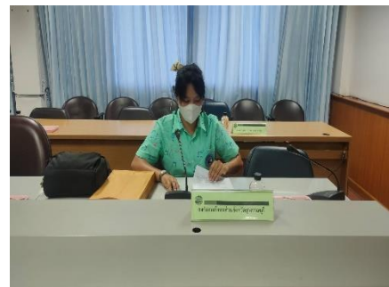
ดำเนินการประชุมชี้แจงคณะทำงานพิจารณาลั่นกรองโครงการจัดระบบคอมพิวเตอร์ของหน่วยงาน สังกัดกระทรวงมหาดไทย จังหวัดสุพรรณบุรี ครั้งที่ ๑/๒๕๖๕ ณ ห้องปฏิบัติการ MC ชั้น ๔ ศาลากลางจังหวัดสุพรรณบุรี