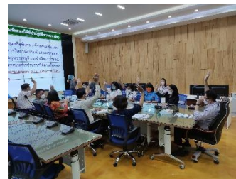
ดำเนินการจัดประชุมคณะกรรมการบริหารจัดการความเสี่ยงของอบจ.สุพรรณบุรี ครั้งที่ ๒/๒๕๖๕ ณ ห้องปฏิบัติการ Conference Room