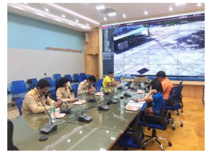
ดำเนินการประชุมปรับปรุงแผนการดำเนินงานบำรุงรักษาซ่อมแซมกล้องโทรทัศน์วงจรปิด (CCTV) MA ณ ห้องปฏิบัติการ Conference Room