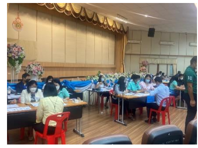
เข้าร่วมเป็นคณะกรรมการสอบสัมภาษณ์ พนักงานจ้าง ขององค์การบริหารส่วนจังหวัดสุพรรณบุรี ณ มหาวิทยาลัยราชภัฏสุพรรณบุรี