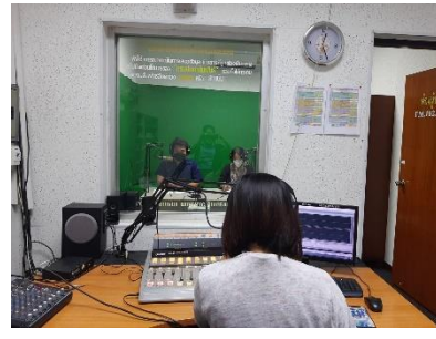
ดำเนินการเข้าร่วมอัตรายการวิทยุ ภารกิจของกองยุทธศาสตร์ และงบประมาณ ณ สวท.สุพรรณบุรี