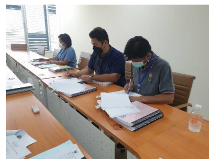
ดำเนินการประชุมคณะกรรมการประเมินผลงาน ครั้งที่ ๒ ณ ห้องประชุมรองปลัดอบจ.สุพรรณบุรี