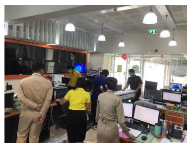
ร้านไอทีสุพรรณ นำเครื่องปิ่นเตอร์ มาให้ยืมใช้งาน และแนะนำวิธีการใช้งานให้กับเจ้าหน้าที่ฝ่ายสถิติข้อมูลและสารสนเทศ