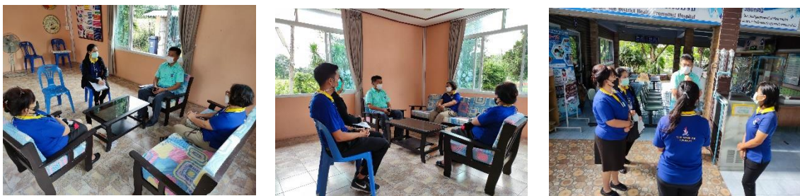
ประสานงานซักซ้อมทำความเข้าใจการขับเคลื่อนการถ่ายโอนภารกิจสถานีนามัยเฉลิมพระเกียรติ ๖๐ พรรชน นวมินทรราชินี และโรงพยาบาลส่งเสริมสุขภาพตำบลให้แก่องค์กรบริหารส่วนจังหวัดสุพรรณบุรีในพื้นที่อำเภอเดิมบางนางบวช วันที่ ๒๓ พฤศจิกายน ๒๕๖๔ และวันที่ ๒๕ พฤศจิกายน ๒๕๖๔