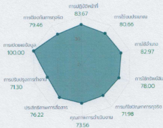
ภาพแสดงผลการดำเนินงานของเจ้าหน้าที่ในหน่วยงานภาครัฐ ประจำปี 2562