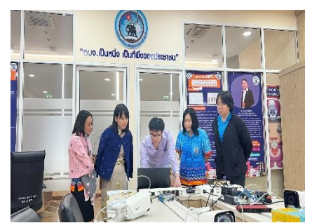
เข้าทดสอบระบบโครงการเพื่อเพิ่มศักยภาพในการป้องกันชีวิตและทรัพย์สินของประชาชน โดยการจัดซื้อกล้องโทรทัศน์วงจรปิด (CCTV) มูลค่า ๑๕ ล้านบาท กับเจ้าหน้าที่จาก บริษัท ไอพีเอส เซลล์ แอนด์ เซอร์วิส จำกัด และ บริษัท พี.ซี.เทเลคอม จำกัด