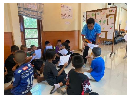
ดำเนินการลงพื้นที่ที่ออกแบบสอบถามประเมินผลการดำเนินงานโครงการส่งเสริมการศึกษาเพื่อพัฒนาศักยภาพเด็กและเยาวชนจังหวัดสุพรรณบุรี (ค่ายทักษะชีวิต) ประจำปีงบประมาณ พ.ศ.๒๕๖๗