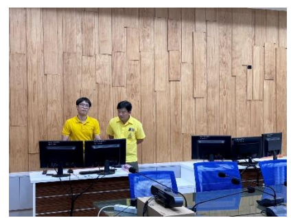
เข้าร่วมต้อนรับคณะศึกษาดูงานจากสถาบันพัฒนาบุคลากรท้องถิ่นในการรับชมภาพจากกล้องโทรทัศน์วงจรปิด (CCTV)