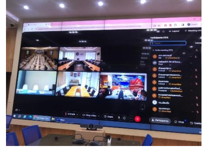
เข้าร่วมประชุมคณะกรรมการวิสามัญพิจารณาศึกษาร่างพระราชบัญญัติงบประมาณรายจ่ายประจำปีงบประมาณ พ.ศ.๒๕๖๗ วุฒิสภาฯ ครั้งที่ ๓๔/๒๕๖๗