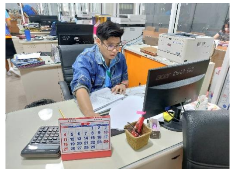
ดำเนินการซ่อมบำรุงดูแลรักษาเครื่องคอมพิวเตอร์/เครื่องปริ้นเตอร์/ลงโปรแกรม, เชื่อมระบบโทรศัพท์ กองพัสดุและทรัพย์สิน,หน่วยตรวจสอบภายใน, ห้องประชาสัมพันธ์,กองสาธารณสุข, สำนักปลัดฯ , สำนักเลขาฯ ห้องประชุมสภาฯ , ห้องประชุมข้างห้องนายกฯ , กองพัสดุฯ , กองการศึกษา และห้องกองการเจ้าหน้าที่