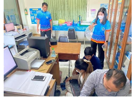
ดำเนินการลงพื้นที่ติดตั้งระบบการดึงข้อมูล และ โปรแกรมการควบคุมระยะไกล ณ รพ.สต.