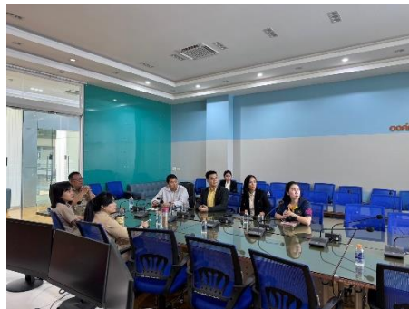
นำคณะเจ้าหน้าที่จาก บริษัท ดั่งภูมิ จำกัด เข้าเสนอเกี่ยวกับระบบซอฟต์แวร์ รพ.สท.