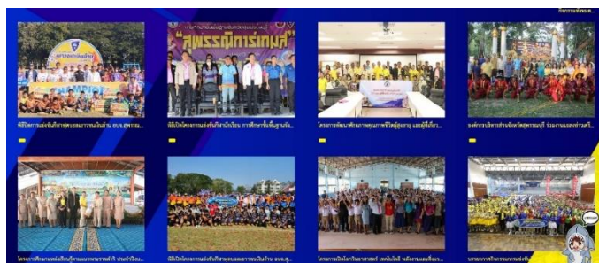
ดำเนินการลงข้อมูลกิจกรรมองค์การบริหารส่วนจังหวัดสุพรรณบุรี ลงบนเว็บไซต์ www.suphan.go.th