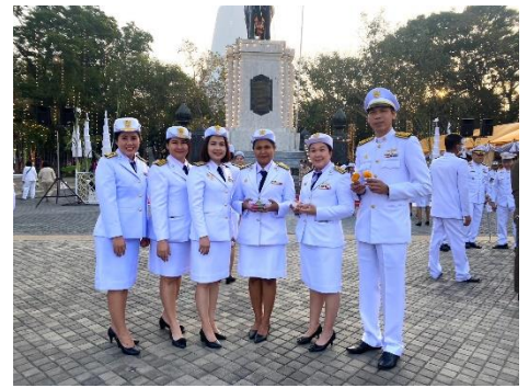
เข้าร่วมพิธีบวงสรวง พิธีถวายราชสักการะสมเด็จพระนเรศวรมหาราช ณ พระบรมราชานุสรณ์ดอนเจดีย์ อ.ดอนเจดีย์