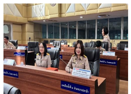
ดำเนินการลงนามบันทึกข้อตกลงความร่วมมือในการจัดบริการสาธารณะ (MOU) ระหว่างอบจ.สุพรรณบุรี และ อบต.ทับตีเหล็ก