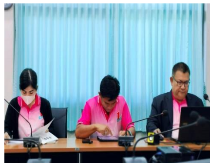
เข้าร่วมประชุมร่วมกับองค์การบริหารส่วนตำบลทับตีเหล็ก เรื่องการบริหารบ้านเมืองที่ดี ณ องค์การบริหารส่วนตำบลทับตีเหล็ก