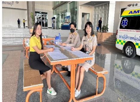
ปฏิบัติหน้าที่จุดควบคุมภูมิบุคลากรขององค์การบริหารส่วนจังหวัดสุพรรณบุรี