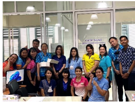
กิจกรรม ๓ ม ร่วมอวยพรวันเกิดให้แก่เจ้าหน้าที่กองยุทธศาสตร์และงบประมาณ