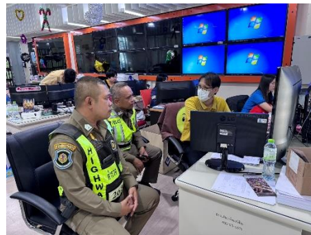
ดำเนินการให้บริการเจ้าหน้าที่ตำรวจและประชาชน ในการดูภาพย้อนหลังจากกล้องโทรทัศน์วงจรปิด (CCTV) ณ ห้องฝ่ายสถิติข้อมูลและสารสนเทศ อบจ.สุพรรณบุรี