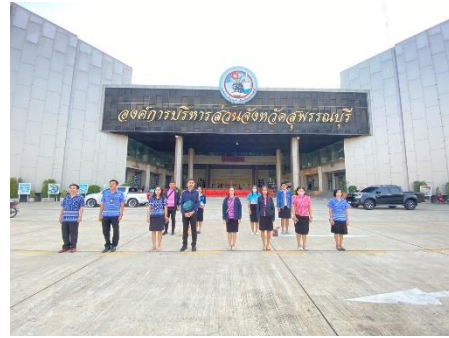
เข้าร่วมกิจกรรมเข้าแถวเคารพธงชาติหน้าเสาธง องค์การบริหารส่วนจังหวัดสุพรรณบุรี