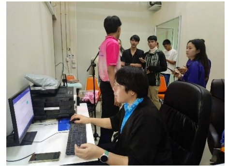
ดำเนินการควบคุมจอหอประชุมใหญ่ ชั้น ๑ อบจ.สุพรรณบุรี โครงการ อบจ.สุพรรณบุรี TO BE NUMBER ONE กิจกรรมคัดเลือกเยาวชนต้นแบบเก่งและดี TO BE NUMBER ONE IDOL