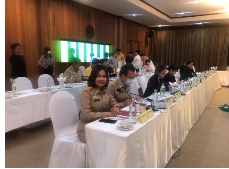
เข้าร่วมประชุมคณะกรรมการร่วมภาครัฐและเอกชนเพื่อแก้ปัญหาทางเศรษฐกิจ (กรอ.) กลุ่มจังหวัดภาคกลางตอนล่าง ๑ ครั้งที่ ๑/๒๕๖๗ ณ ห้องประชุมกัวนา ๑ โรงแรมรอยัลริเวอร์แคว รีสอร์ท จังหวัดกาญจนบุรี