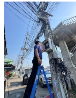
ดำเนินการลงพื้นที่ตรวจสอบกล้องโทรทัศน์วงจรปิด (CCTV) โครงการจ้างเหมาบำรุงรักษา (MA) ประจำเดือน มกราคม