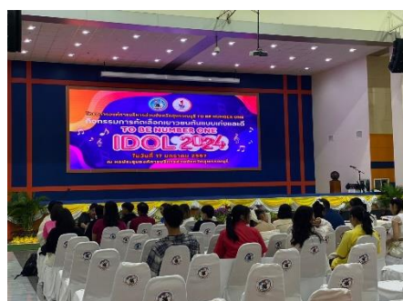
ดำเนินการทอแบบประเมินผลการดำเนินการโครงการ อบจ.สุพรรณบุรี TO BE NUMBER ONE กิจกรรมคัดเลือกเยาวชนต้นแบบเก่งและดี TO BE NUMBER ONE IDOL