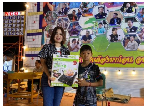
ปฏิบัติหน้าที่ประจำร้านบิงโก วันที่ ๒๐ มกราคม ๒๕๖๗