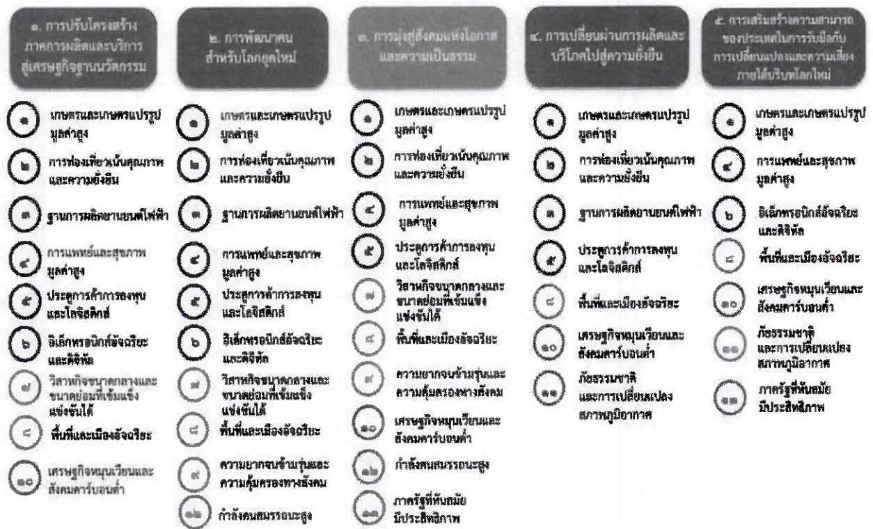
แผนภาพที่ ๓.๑ ความเชื่อมโยงระหว่างหมวดหมู่การพัฒนากับเป้าหมายหลัก

สมรรถนะสูงและคล่องตัว สามารถก้าวสู่การเป็นภาครัฐดิจิทัลอย่างเต็มรูปแบบ รวมถึงการยกเลิกกฎหมายที่ไม่จำเป็น และเป็นอุปสรรคต่อการพัฒนาประเทศ