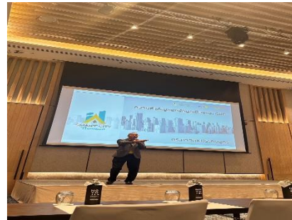
เข้าร่วมอบรม ความสำคัญของข้อมูลเมืองและ CDP ณ โรงแรมโนโวเทล กรุงเทพ พิวเจอร์พาร์ค รังสิต