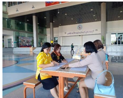
ปฏิบัติหน้าที่จัดอุดมภูมิบุคลากรขององค์การบริหารส่วนจังหวัดสุพรรณบุรี