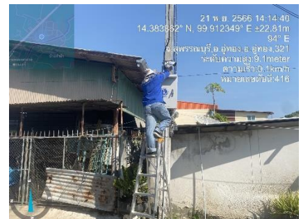
ดำเนินการลงพื้นที่ควบคุมงานโครงการเพิ่มศักยภาพในการป้องกันชีวิตและทรัพย์สินของประชาชน กล้องโทรทัศน์ วงจรปิด CCTV ๒๕ ล้านบาท ณ อำเภ่อู้อทอง ,อำเภอดำเนินสะดวก