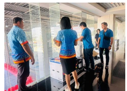
ดำเนินการตรวจรับครุภัณฑ์คอมพิวเตอร์