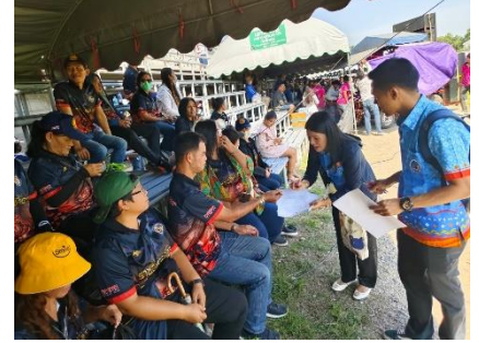
ดำเนินการลงพื้นที่ที่ออกแบบประเมินผลการดำเนินการโครงการแข่งขันกีฬา อบจ.สุพรรณบุรี รวมใจกำนัน-ผู้ใหญ่บ้าน สานสัมพันธ์ประชาชน ปีที่ ๑๖ ประจำปี ๒๕๖๖