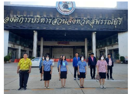
เข้าร่วมกิจกรรมเข้าแถวเคารพธงชาติหน้าเสาธง องค์การบริหารส่วนจังหวัดสุพรรณบุรี