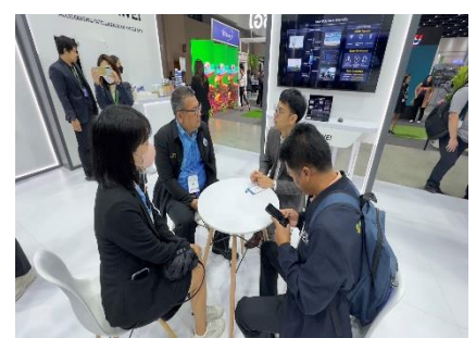
เข้าอบรมและรับรางวัล Smart City Expo ๒๐๒๓ งานแสดงเทคโนโลยีและนวัตกรรม สำหรับเมืองอัจฉริยะ ครั้งที่ ๒ ณ ศูนย์ประชุมแห่งชาติสิริกิติ์ และเข้ารับรางวัลเขตส่งเสริมเมืองอัจฉริยะ