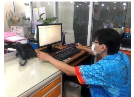
ดำเนินการซ่อมบำรุงดูแลรักษาเครื่องคอมพิวเตอร์/เครื่องปริ้นเตอร์/ลงโปรแกรม, เซิร์ฟเวอร์, ระบบโทรศัพท์, กองพัสดุและทรัพย์สิน, หน่วยตรวจสอบภายใน, ห้องประชาสัมพันธ์, กองสาธารณสุข, สำนักปลัดฯ, สำนักเลขาฯ, ห้องประชุมสภาฯ, ห้องประชุมข้างห้องนายกฯ, กองพัสดุฯ, กองการศึกษาฯ และห้องกองการเจ้าหน้าที่