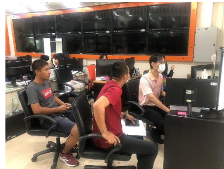
ดำเนินการให้บริการเจ้าหน้าที่ตำรวจและประชาชน ในการดูภาพย้อนหลังจากกล้องโทรทัศน์วงจรปิด (CCTV) ณ ห้องฝ่ายสถิติข้อมูลและสารสนเทศ อบจ.สุพรรณบุรี