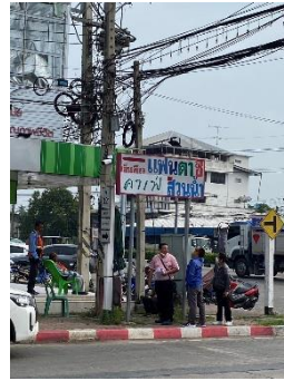
ดำเนินการลงพื้นที่ควบคุมงานติดตั้งกล่อง โครงการ ๒๕ ล้าน อ.อุทอง