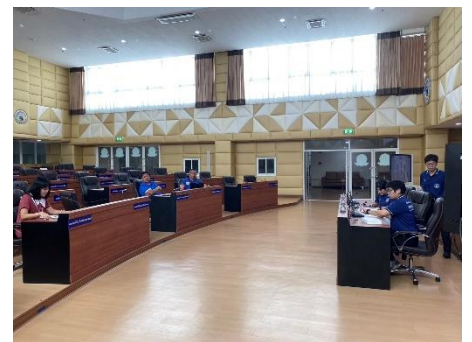
ดำเนินการซักซ้อมเตรียมความพร้อมการนำเสนอโครงการรางวัลพระปกเกล้า ณ ห้องประชุมสภา