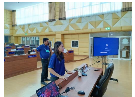
ดำเนินการเตรียมความพร้อมห้องประชุมซักซ้อมการนำเสนอโครงการรางวัลพระปกเกล้า ณ ห้องประชุมสภา ชั้น ๓ อบจ.สุพรรณบุรี