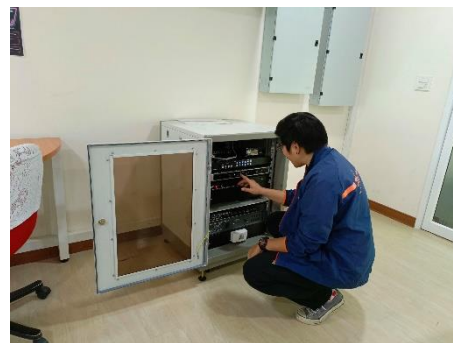
ดำเนินการเตรียมห้องประชุมแผนดำเนินงาน ปี ๒๕๖๗ คณะกรรมการสนับสนุนฯ ห้องประชุม ๑ ข้างห้องนายก (ชั้น ๓)