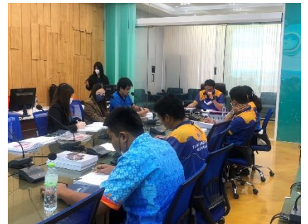
เข้าร่วมประชุมคณะกรรมการตรวจรับและควบคุมงานติดตั้งกล้องโครงการเพิ่มศักยภาพในการป้องกันชีวิตและทรัพย์สินของประชาชน (๒๕ ล้านบาท)