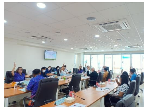
ดำเนินการการประชุมคณะกรรมการพัฒนาเพื่อจัดทำร่างแผนดำเนินงานประจำปีงบประมาณ ๒๕๖๗ องค์การบริหารส่วนจังหวัดสุพรรณบุรี ครั้งที่ ๔/๒๕๖๖