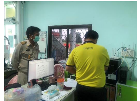
ดำเนินการลงพื้นที่ตรวจสอบระบบเครือข่าย (Network) อำเภออู่ทอง