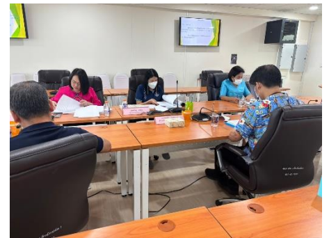
ดำเนินการจัดประชุมคณะกรรมการสนับสนุนการจัดทำแผนพัฒนาเพื่อจัดทำร่างแผนดำเนินงานประจำปีงบประมาณ ๒๕๖๗ องค์การบริหารส่วนจังหวัดสุพรรณบุรี ครั้งที่ ๔/๒๕๖๖