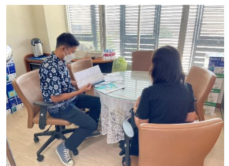
ดำเนินการตรวจรายงานเงินอุดหนุนโครงการจัดซื้อสื่อมอนเตสเซอร์รี่