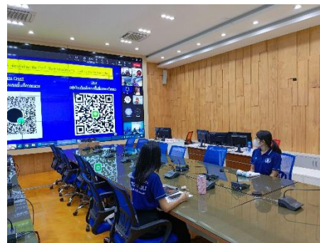
เข้าร่วมประชุมโครงการพัฒนาโค้ดดิ้งพัฒนาคุณภาพชีวิต (coding for better lift)