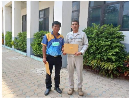
ดำเนินการส่งหนังสือขออนุญาตพาดสายที่ กฟภ อุทอง บริเวณแยกดินเป็ด