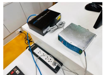
เข้าร่วมประชุมคณะกรรมการพิจารณาผลโครงการจ้างเหมาบริการบำรุงรักษากล้องโทรทัศน์วงจรปิด CCTV (MA) จำนวน ๑,๘๓๙ ตัว ปีงบประมาณ ๒๕๖๗