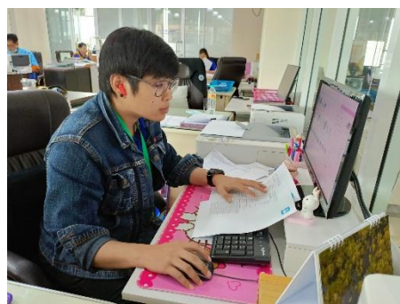
ดำเนินการซ่อมบำรุงดูแลรักษาเครื่องคอมพิวเตอร์/เครื่องปริ้นเตอร์/ลงโปรแกรม, เซิร์ฟเวอร์คอมพิวเตอร์ กองพัสดุและทรัพย์สิน,หน่วยตรวจสอบภายใน, ห้องประชาสัมพันธ์,กองสาธารณสุข, สำนักปลัดฯ, สำนักเลขานุการ, ห้องประชุมสภา, ห้องประชุมข้างห้องนายกฯ, กองพัสดุฯ, กองการศึกษา และห้องกองการเจ้าหน้าที่