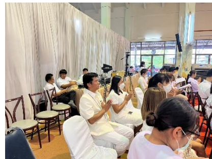
เข้าร่วมกิจกรรมการจัดพิธีเจริญพระพุทธมนต์ถวายพระพรชัยมงคลแด่ สมเด็จพระเจ้าลูกเธอ เจ้าฟ้าพัชรกิติยาภา นเรนทิราเทพยวดี กรมหลวงราชสาริณีสิริพัชร มหาวัชรราชธิดา ณ วัดป่าเลไลยก์วรวิหาร