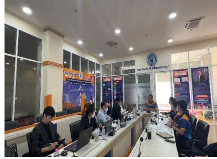
เข้าร่วมประชุมการขอความร่วมมือทดลองใช้งานระบบงาน smart รพ.สต.