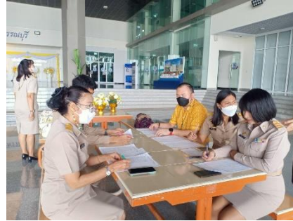
ปฏิบัติหน้าที่จัดอณูมิมุขการขององค์การบริหารส่วนจังหวัดสุพรรณบุรี