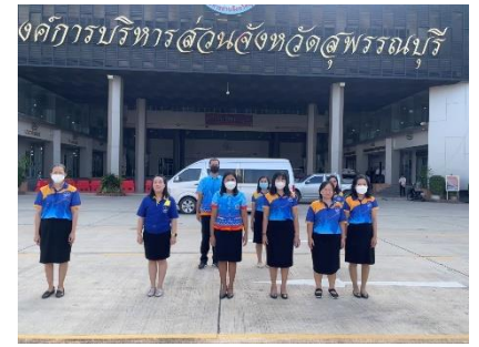
เข้าร่วมกิจกรรมเข้าแถวเคารพธงชาติหน้าเสาธง องค์การบริหารส่วนจังหวัดสุพรรณบุรี