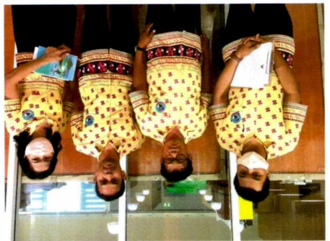
๓๑๓๓ ผลงาน ๑๑ ผู้พัฒนา ๑๑๑๑๑๑ ๒๑๑๑๑๑๑๑๑๑๑๑