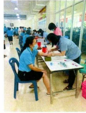
ตรวจสอบภาพประจำปีของข้าราชการและผู้ประกันตน วันที่ ๑๑ สิงหาคม ๒๖๓ ณ ห้องประชุมองค์การบริหารส่วนจังหวัดสุพรรณบุรี