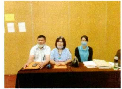
ประชุมเชิงปฏิบัติการทบทวนแผนพัฒนาจังหวัดและแผนปฏิบัติราชการจังหวัดสุพรรณบุรี ประจำปีงบประมาณ พ.ศ. ๒๕๖๕ วันที่ ๑๑ สิงหาคม ๒๕๖๓ ณ โรงแรมสองพันบุรี