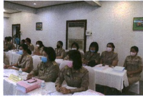
ประชุมสภา อบจ.สุพรรณบุรี สมัยสามัญ สมัยที่ ๒ ครั้งที่ ๑ ประจำปี ๒๕๖๓ ณ ห้องโพลิน โรงแรมเพชร อำเภอเมือง จังหวัดสุพรรณบุรี