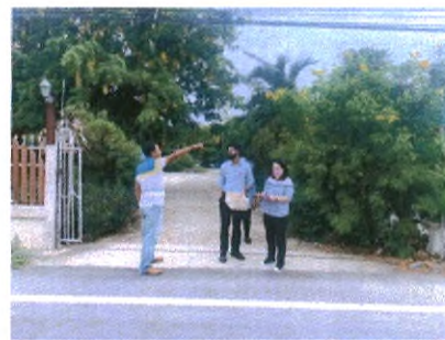
ติดตามประเมินโครงการปรับปรุงมิวจากราดยางสายบ้านบางหมัน - บ้านท่าเสด็จ อำเภอเมือง จังหวัดสุพรรณบุรี