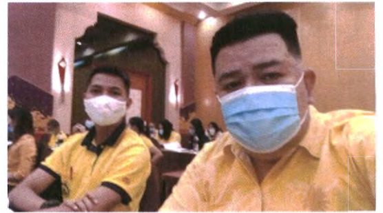
เข้าร่วมโครงการอบรมการประเมินประสิทธิภาพขององค์กรปกครองส่วนท้องถิ่น (Local Performance Assessment : LPA) จังหวัดสุพรรณบุรี ประจำปี ๒๕๖๓ ด้านที่ ๑ วันที่ ๘ กรกฎาคม ๒๕๖๓ ณ โรงแรมสองพันบุรี อำเภอเมือง จังหวัดสุพรรณบุรี