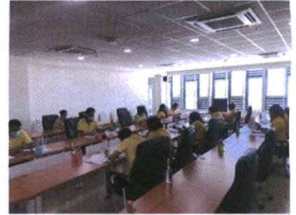
ประชุมเตรียมความพร้อมในการจัดทำร่างข้อบัญญัติงบประมาณรายจ่ายประจำปี พ.ศ. ๒๕๖๔ ครั้งที่ ๓/๒๕๖๓ วันที่ ๘ กรกฎาคม ๒๕๖๓ ณ ห้องประชุม ๑ ชั้น ๓ อบจ.สุพรรณบุรี