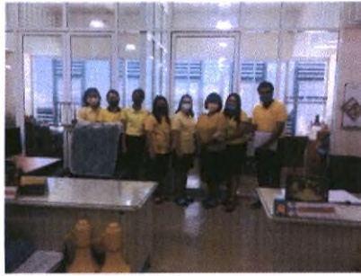
รับตรวจประเมินผลการปฏิบัติงานกิจกรรม ๕ ส ประจำเดือน กรกฎาคม ๒๕๖๓ วันที่ ๘ กรกฎาคม ๒๕๖๓